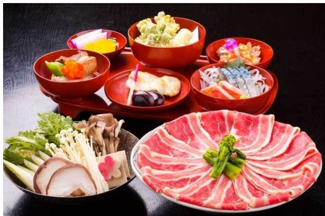
牛すき焼きコース