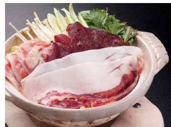
ジビエ鍋 (猪・鹿肉・地鶏)