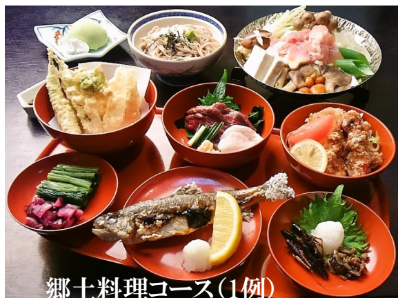
郷土料理コース(1例)