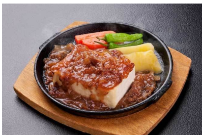
豆腐ステーキ重 850円

出前 【会議用弁当】 1,000円・1,200円・1,500円 2,000円 無添加、ヘルシー弁当 (税別途)