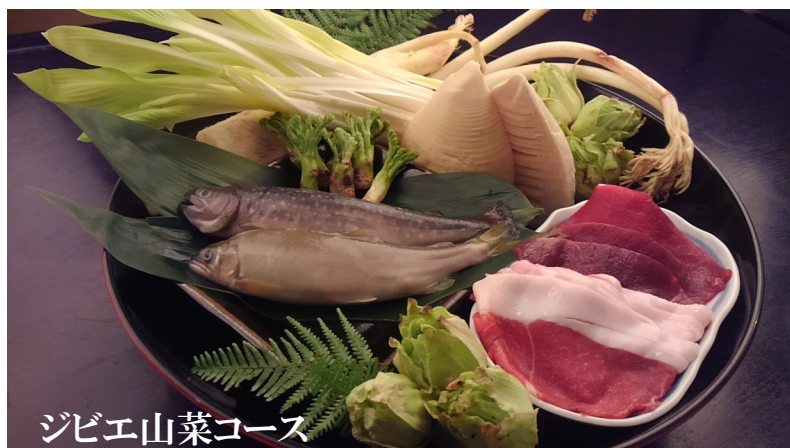
ジビエ山菜コース

※ お弁当のご注文は、前日までにお願いいたします。※ 味噌汁、お吸い物、お茶など (各100円) お弁当内容、ご予算等 ご希望があればお気軽に申し付けてください。 内容は季節、入荷により変わります。出前はお昼、夕方も承ります